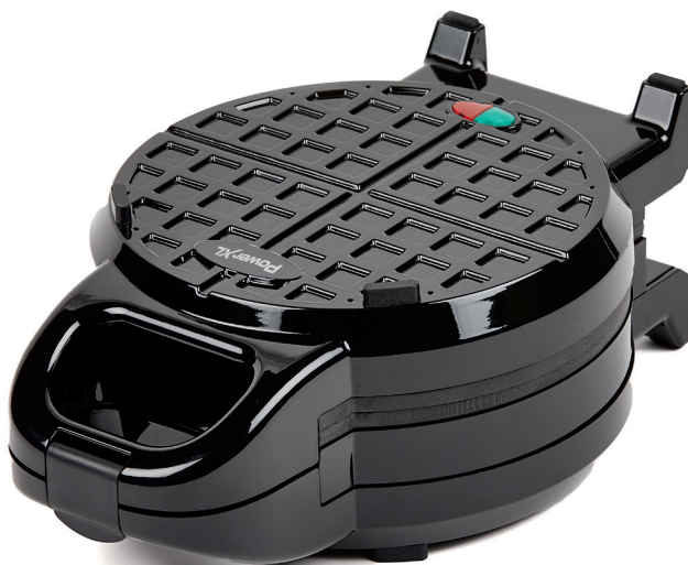
PRŮMĚR 18 CM 18 CM DIAMETRU