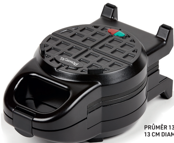
PRŮMĚR 13 CM 13 CM DIAMETRU